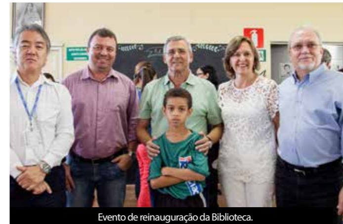
Evento de reinauguração da Biblioteca.

O projeto apresentado pela Ramacrisna, beneficiando a biblioteca, foi selecionado e patrocinado por meio de edital da Fundação Biblioteca Nacional, ligada ao Ministério da Cultura e ao Sistema Nacional de Bibliotecas Públicas. O espaço foi inteiramente renovado utilizando mobiliários sustentáveis e teve a participação dos leitores na sua customização. As crianças do CAER – Centro de Apoio Educacional Ramacrisna, alunos de cinco escolas públicas, cobriram armários com seus desenhos coloridos e alegres; os Antenados representaram os jovens leitores, customizando armários e prateleiras com reaproveitamento de revestimentos em quadrinho e as mulheres da Cooperativa Futurarte utilizaram retalhos de tecido para cobrir estantes, como participantes da comunidade. O resultado foi muita cor, diversidade de material e a presença de todo o público atendido pela biblioteca na construção do novo espaço, que na fala de todos ficou lindo, acolhedor, confortável, colorido e sustentável.