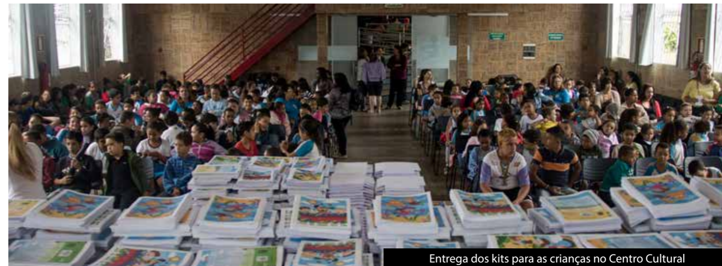
Entrega dos kits para as crianças no Centro Cultural

O Projeto Futuro Promissor realizado pelo Rotary Clube de Belo Horizonte Liberdade desde o ano de 2011, arrecada fundos para doação de kits de material escolar para alunos de cinco escolas públicas, atendidos pela Ramacrisna. O projeto está na sua 5ª edição, já beneficiou 1340 crianças e tem como objetivo motivar os alunos a permanecer na escola e aumentar seu rendimento escolar.