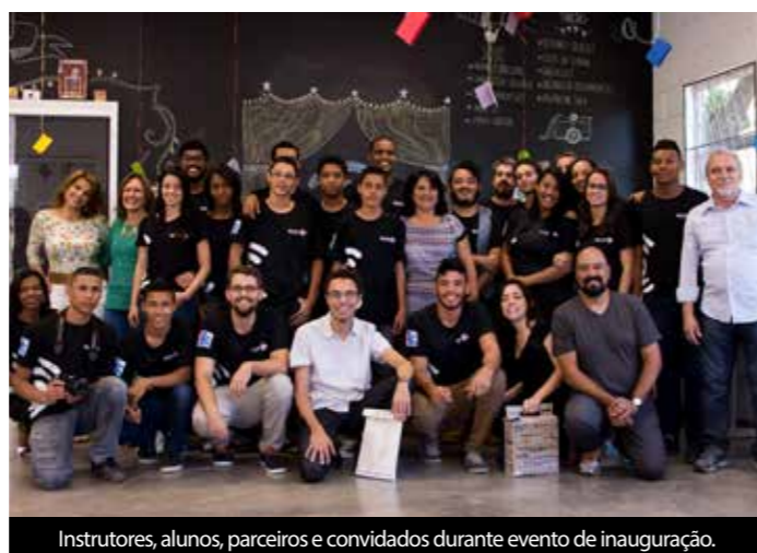
Instrutores, alunos, parceiros e convidados durante evento de inauguração.

O lançamento do espaço marca também o novo momento do Antenados – que iniciou-se em 2007 como projeto social da Ramacrisna, focado em oferecer conhecimento em audiovisual para jovens da zona rural de Betim, e agora passa a ser também produtora de vídeo, com diferencial de ser especializada em Terceiro Setor, já que teve sua origem nesse segmento e portanto conta com experiência na área.